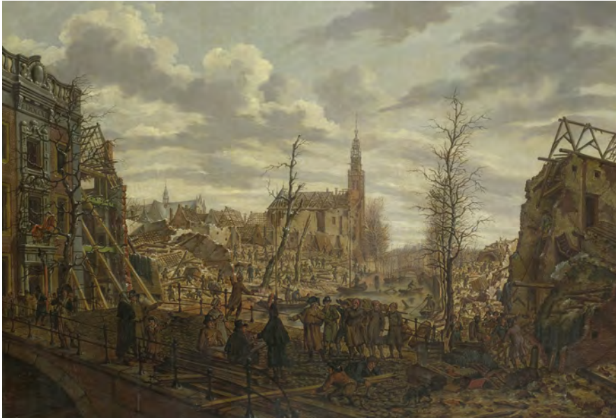
Het Rapenburg te Leiden drie dagen na de ontploffing van het kruitschip op 12 januari 1807, Johannes Jelgerhuis, 1807.