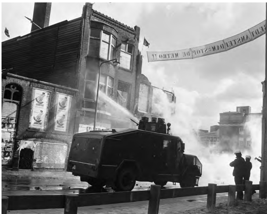
Rellen bij ontruiming panden in Nieuwmarktbuurt in Amsterdam; waterkanon in actie tegen demonstranten, 24-3-1975.