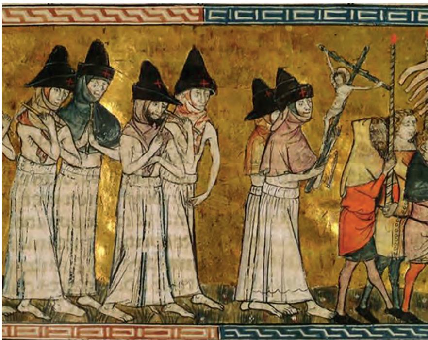
Flagellantenprocessie in Doornik, miniatuur uit de kroniek van Aegidius Li Muisis, 1349.

van crisisbeheersing, die de staat van crisisbeheersing ijkt aan de géést van crisisbeheersing. De dramadriehoek vergroot de crisiskloof slechts. Alle partijen die bij de beheersing van crisis nodig zijn, zullen met elkaar moeten voorkomen in die crisiskloof terecht te komen. Alle zeilen moeten worden bijgezet. De centrale overheid moet een eerlijker en dus moeilijker (want ingrijpender en minder rooskleurig) verhaal vertellen over noodzaak en nut van investeringen in crisismaatregelen. Er moet in het eigen vlees gesneden worden, crisisbeheersing gaat ons wat kosten. De samenleving moet begrijpen dat dat is iets wat er de komende generaties bij gaat horen – of het nu gaat om het klimaat, de gaswinning, of Oekraïne.