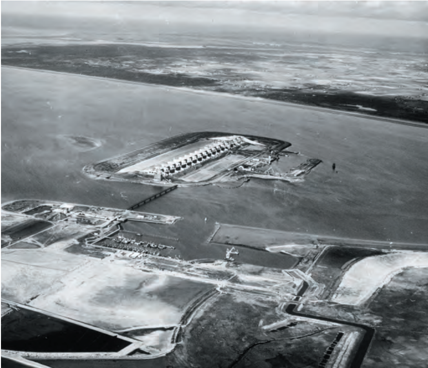
Aanleg van de Haringvlietdam met spuisluizen tussen Voorne-Putten en Goeree-Overflakkee, als onderdeel van de Deltawerken, 15-11-1965.

vergroten die maatregelen, plannen en decreten de breuken in de samenleving juist. En dan worden de crisismaatregelen, of de 'heersende elites' zelf als bron van crisis beschouwd.