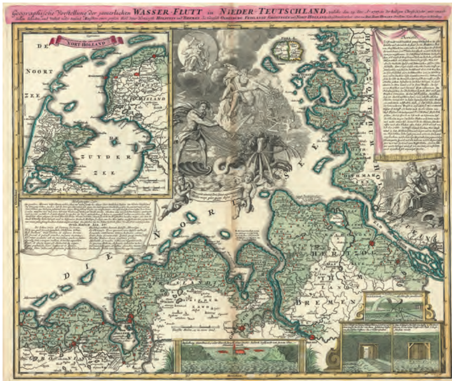
Kaart van Oost-Friesland en het noorden van de provincie Groningen waarop de gebieden die door de overstroming onder water zijn komen te staan (Kerstvloed), zijn aangegeven, 1718-1720.