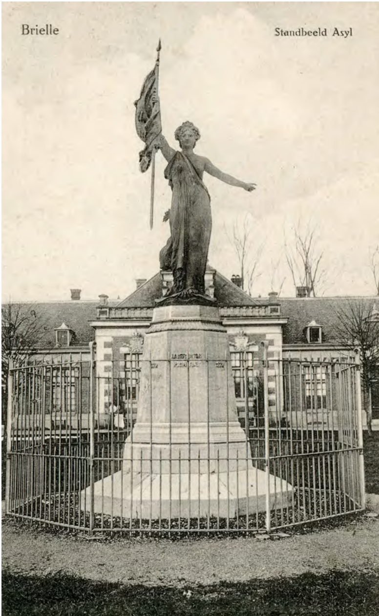
De Zeenymph in Brielle Streekarchief Voorne-Putten