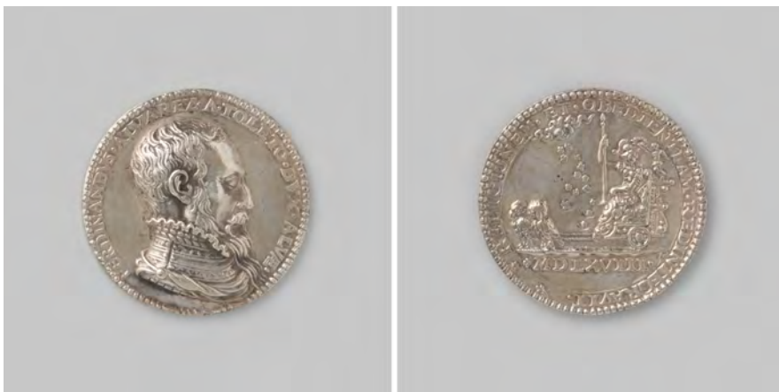
Gedenkpenning voor Alva's overwinningen op Oranje in 1568, Rijksmuseum Amsterdam, NG-VG-1.370.