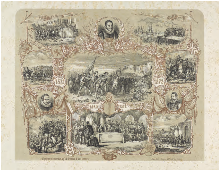
Nationale feestviering op 1 april 1872 van de 300-jarige inname van Den Briel, anoniem, 1872 Rijksmuseum Amsterdam

een van de meest controversiële geweest. De omstredenheid is bekend. De Watergeuzen hadden met de inname van Den Briel het definitieve startschot voor de Opstand gegeven, maar hun aanvoerder Lumey was op dezelfde plek ook verantwoordelijk geweest voor het folteren en ophangen van de katholieke geestelijken, die als Martelaren van Gorcum de geschiedenis in zouden gaan. Enkele jaren voor de herdenking van 1872, in 1867, had de katholieke kerk de Martelaren heilig verklaard, en was Brielle ook een belangrijk katholiek bedevaartsoord geworden. 6 Daarmee werd de herdenking als vanzelf niet alleen een