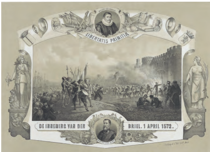
De Inneming van Den Briel. 1 April 1572, anoniem, 1872 Rijksmuseum Amsterdam

wat herdacht werd en welke lessen zouden worden getrokken? Die twee paradoxen – de nationale herdenking als stimulans voor lokale trots én als stimulans voor onenigheid in plaats van harmonie – wil ik vandaag met u bespreken. Ik zal mijn uitgangspunt nemen in de negentiende eeuw, vaak de eeuw van het nationalisme genoemd, maar ook de eeuw van fervente lokale herdenkingen.