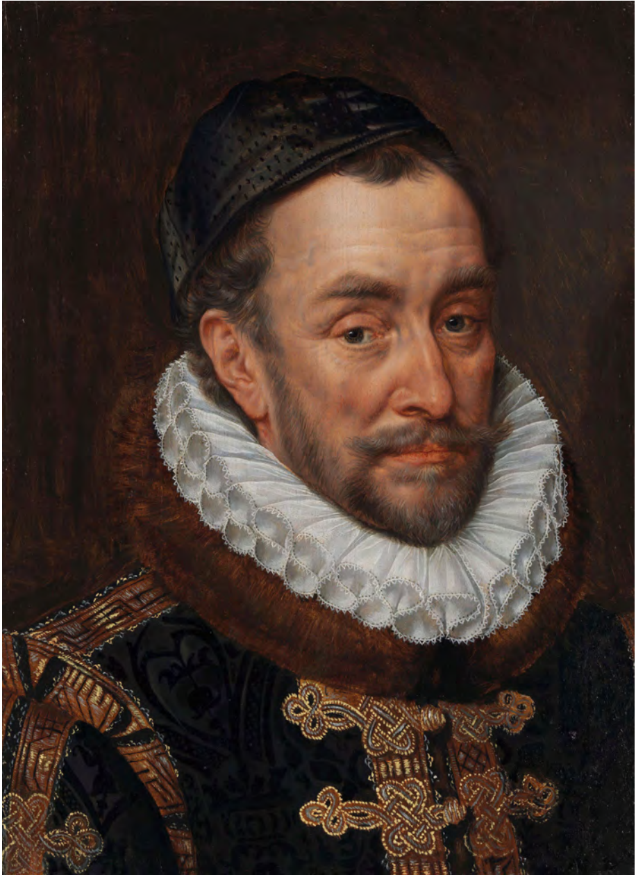
Adriaen Thomasz Key, Portret van Willem van Oranje (1579), Rijksmuseum Amsterdam, SK-A 3148