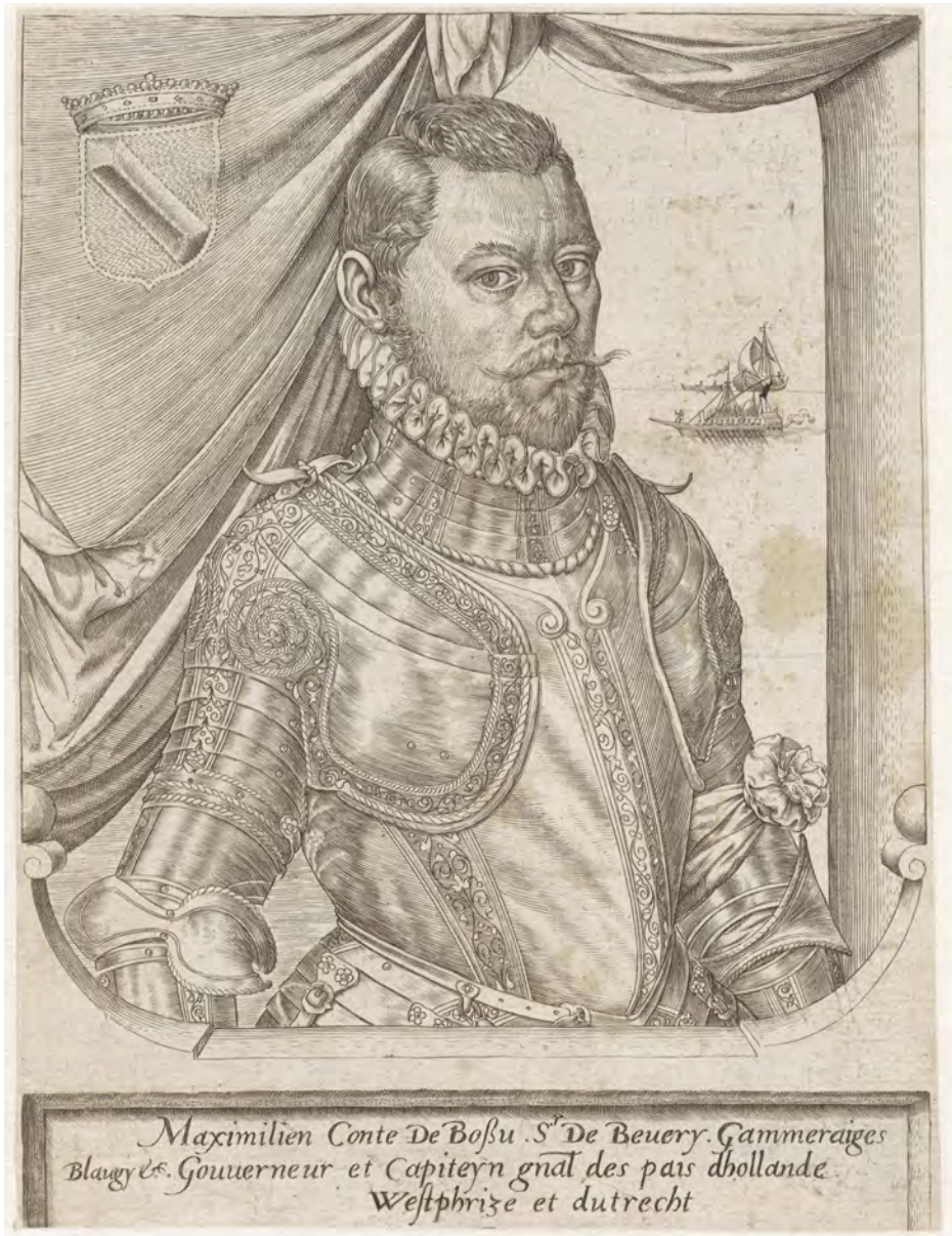
Maximilien Conte De Bossu .S r De Beuery. Gammerraiges Blaugy & Gouverneur et Capiteyn gnal des pais dhollande Westphrize et dutrecht

Paulus van Wtewael, Maximiliaan van Hennin, heer van Bossu, 1573, Rijksmuseum Amsterdam, RP-P-OB-24.850. Na Oranjes vertrek naar de Dillenburg in 1567 was hij als stadhouder opgevolgd door Bossu, die zich voor de moeilijke taak zag gesteld om Holland te verdedigen tegen de watergeuzen.