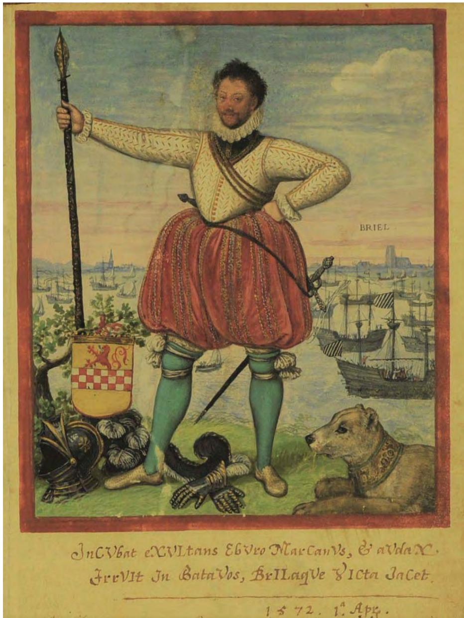
Anoniem, Willem van de Marck, heer van Lummen, beter bekend als Lumey. Nationaal Archief, Den Haag, Archief Familie van Wassenaer van Duvenvoorde, toegang 3.20.87, inv. No 3A.