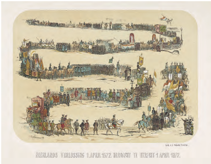
Neerlands Verlossing 1 April 1572. Herdacht te Utrecht 1 April 1872, J. Nijkerk, naar Jozef Hoevenaar, 1872 Rijksmuseum Amsterdam

meegemaakt? Het eigenlijke begin van de Opstand tegen Spanje, en dus het begin van het land en van de vrijheid werden gevierd, en dat moest iedereen weten. De herdenking was een enorm succes, met Brielle als stralend middelpunt. De oude glorie en de nieuwe media maakten Brielle voor even het centrum van het land. Lokale en nationale trots gingen hand in hand. 5