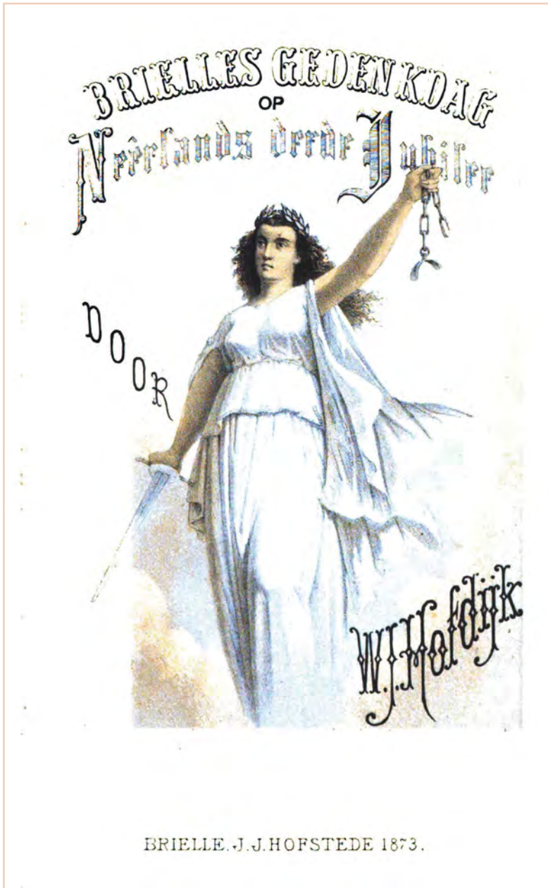
Omslag Brielles Gedenkdag van Hofdijk