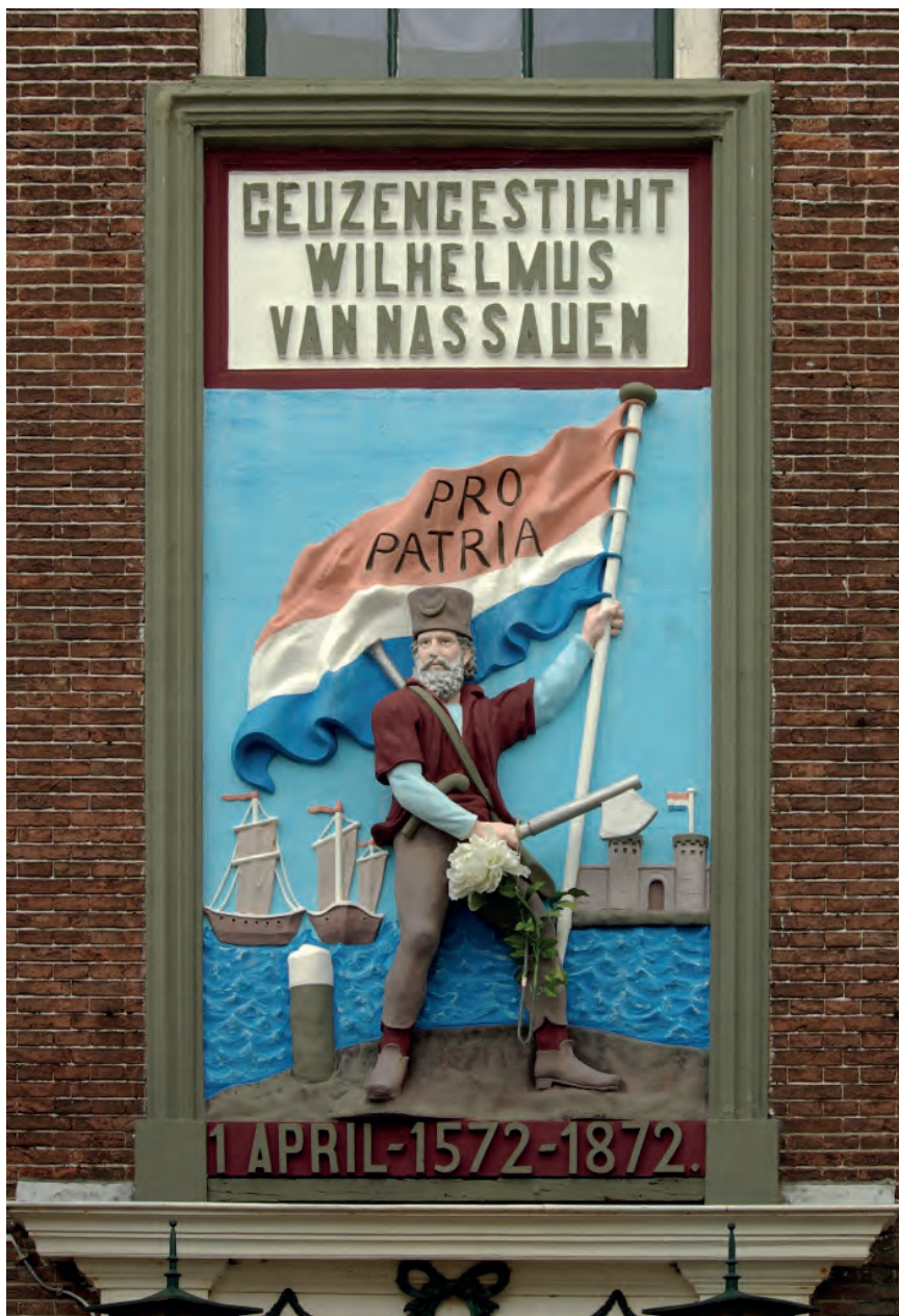
Gevelsteen van het Geuzengesticht in Brielle