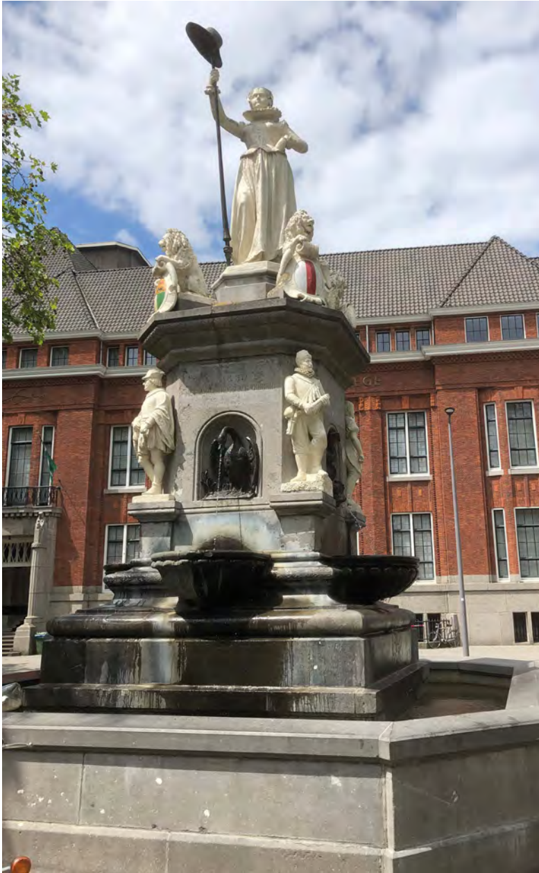
De Maagd van Holland in Rotterdam