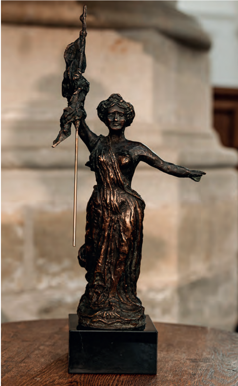
Replica standbeeld van de Nymph