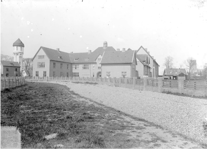
De Hogere Burgerschool (HBS), met watertoren; ca. 1925

De HBS was de toekomst, modern en dynamisch, en er zouden ook mooie gebouwen voor neer worden gezet – het latere gebouw van de voormalige Rijks-HBS in Den Briel wordt juist nu tot meer dan twintig appartementen verbouwd. Maar in zijn eentje kon de school natuurlijk niet alle problemen oplossen. Als symbool van de toekomst werd de HBS weliswaar vaak op één lijn gesteld met de toen even nieuwe spoorwegen, maar spoorwegen waren praktisch toch van meer betekenis. In 1868, vier jaar voor het feest van Den Briel, was de slag bij Heiligerlee op het slagveld van 1568 in de provincie Groningen herdacht. De nationale dichter Nicolaas Beets dichtte toen op het slagveld over de vooruitgang van de negentiende eeuw: “Bracht niet de stoomtrein op dit veld het halve vaderland te zamen? Een wenk!