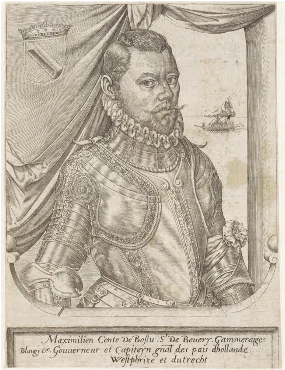
Paulus van Wtewael, Maximiliaan van Hennin, heer van Bossu, 1573, Rijksmuseum Amsterdam, RP-P-OB-24.850. Na Oranjes vertrek naar de Dillenburg in 1567 was hij als stadhouder opgevolgd door Bossu, die zich voor de moeilijke taak zag gesteld om Holland te verdedigen tegen de watergeuzen.