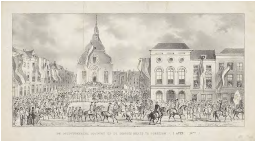
De Gecostumeerde Optocht op de Grootte Markt te Schiedam. (1 April 1872.), Carel Christiaan Antony Last, naar Pieter van der Burg (tekenaar), 1872 Rijksmuseum Amsterdam

als gevolg. 9 De slachtoffers konden katholiek zijn maar evengoed protestant – het hing er maar net vanaf welke groep lokaal de bovenhand had. Er is wel gezegd dat het geweld het gevolg was van een soort van achterlijkheid: in de kleinere plaatsen zou men niet zijn meegenomen in de liberaal getinte landelijke oproepen tot harmonie en compromis en nog niet zo (eensgezind?) nationaal denken als in de grote steden. 10 Er speelde echter waarschijnlijk vooral iets anders. De rellen doen denken aan hedendaagse protesten van boze burgers tegen asielzoekerscentra of confrontaties tussen buurten. Daarbij gaat het om in- en uitsluiting, wij tegenover zij. Onzacht maken de rellen aan buitenstaanders en minderheden duidelijk dat ze zich moeten aanpassen. Zo ging het toen ook. De relschoppers van 1872 waren de boze burgers van de negentiende eeuw. In de katholieken zagen veel protestanten een soort islamisten, onbetrouwbare en